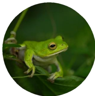
シュレーゲルアオガエル

チョウやバッタが増えると、それらを捕らえるクモやハチが増え、カエルが増えるとヘビの仲間が現れます。里山では一つの命が次の命へと次々に繋がって広がっていきます。生き物たちがにぎわう夏の狭山丘陵にぜひ足を運んでみて下さい。