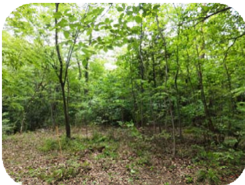
明るくなった作業後の雑木林

昨年度より狭山公園、東大和公園、八国山緑地で「ちょこっとボランティア」(以下、「ちょこボラ」というイベントを定期的で開催しています。「ちょこボラ」とは、雑木林やピオトープ池などの短時間のお手入れを通して、身近な公園の自然やボランティア活動に興味を持ってもらおうというイベントのことで、平成24年6月現在で3回実施し、のべ31人が参加して下さっています。