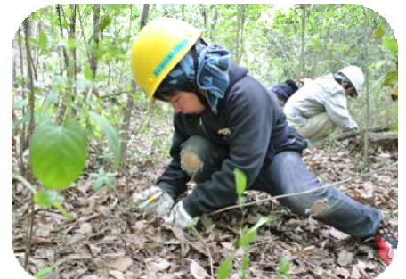
子どももがんばってササ刈り!

今後も多くの方々と一緒に小さなことからコツコツと、いろいろな生きものが見られる公園にしていきます。(今後の予定は裏面を参照下さい。)