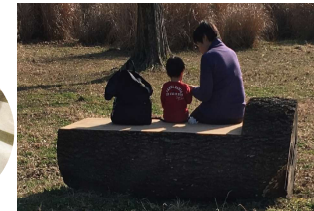
発生材を活用したベンチやクラフト素材

われてきた雑木林の木々。都立公園では新しい利用方法を模索しながら、持続可能な社会に貢献する取組みを行っています。インフォメーションセンターでは、イベント情報や公園の取組みをご紹介します。ぜひお立ち寄りください。