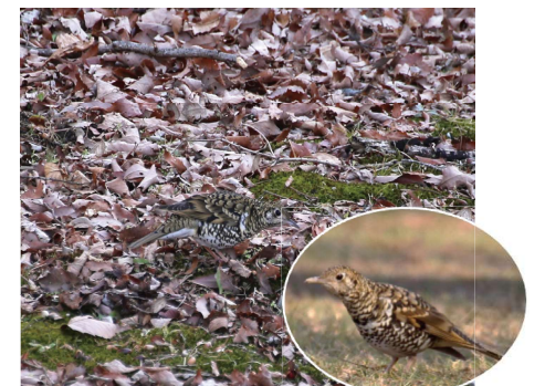
落ち葉の上のトラツグミ どこにいるでしょう？