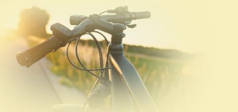
【協力】西多摩マウンテンバイク友の会