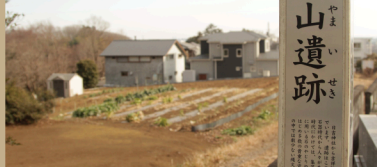
① 吉祥山遺跡 (武蔵村山市) ※看板設置者

旧石器～平安時代の出土品等が発掘された。(出土品は武蔵村山市立歴史民俗資料館で常時展示されている)