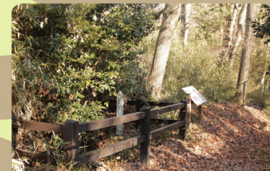
④ 大多羅法師の井戸 (中藤公園内)