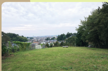
③ 芝生広場 (中藤公園内)