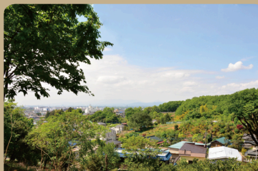
⑤ 桜の丘 (中藤公園内)