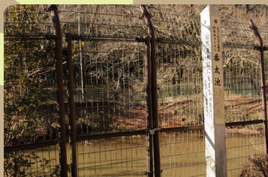
⑥ 番太池 (武蔵村山市)