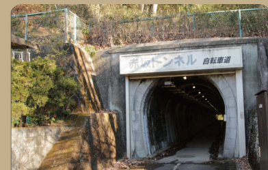
⑦ 赤坂トンネル (武蔵村山市)

山口貯水池建設時、資材運搬の鉄道を通すために作られた。(横田、赤堀、御岳トンネルも同様)