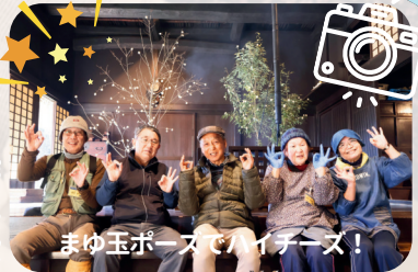
まゆ玉ポーズ! ユーピース!

伝統食つたえたい♪の皆さんと“まゆ玉飾り”を作りました! 公園のお米でお団子を作って枝にさしていきます! 木は雑木林の皆さんに伐って設置していただきました!