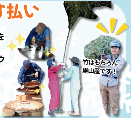
竹はもちろん里山産です!

12/22(日)はすす払い! 1年間の感謝を込めて母屋を綺麗にしました! 高いところはお手製の竹ホウキで掃除します! 皆さんのおかげで、母屋もすっかり綺麗になりました! 今年も大切に使いましょう!