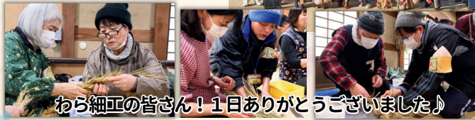
わら細工の皆さん! 1日ありがとうございました!