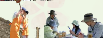
薪割り&枝切り&ペンダント作り

59名のボランティアの皆さんと協力して、楽しく賑やかな春祭りを開催することができました！ 来園者の皆さんの笑顔も沢山見られました☆ ミーティングから準備、当日サポートくださった皆さん ありがとうございました！