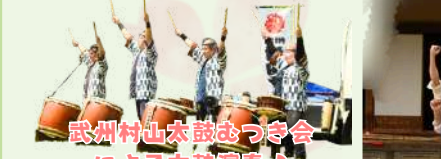
武州村山太鼓おつき会 による太鼓演奏♪