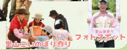
里山こいのぼり作り