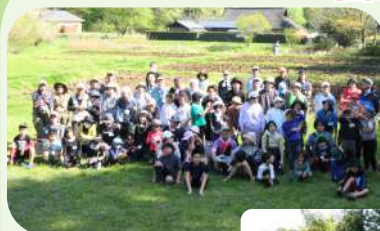
皆さん一緒に ガラ・ガラ・ガラ♪