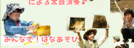
みんなで! はなおそび