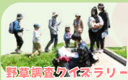
野草調査クイズラリー