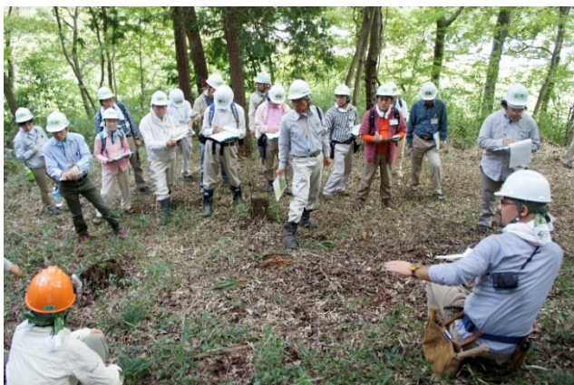
2010年マイスター入門講座(大自然塾)

山の田んぼは宮野入の産業廃棄物の撤去が終わった1998年(平成10)に地元の「岸田んぼ会」によって久しく途絶えていた米作りが始まりました。岸田んぼ会は武蔵村山市からの呼びかけに応じて、途絶えてしまった地域の稲作文化を復活継承したいと地元の有志が集まって発足した団体です。ボランティアが米作りに参加したのは2001年(平成13)からで、当初は岸田んぼ会との共同作業でした。