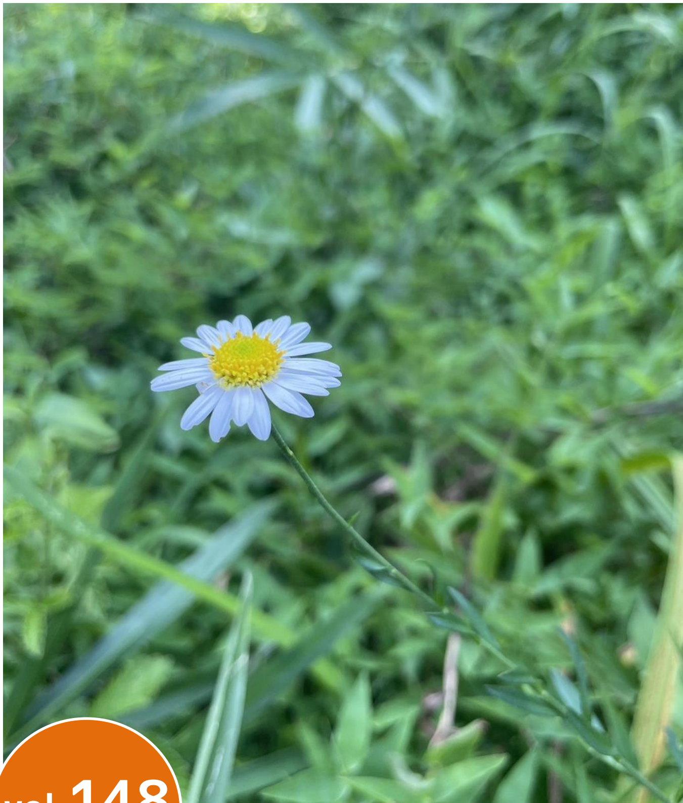
ユウガギク@東大和公園