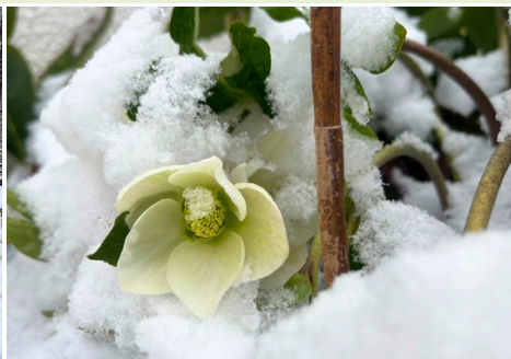
第4トイレ前 クリスマスローズ