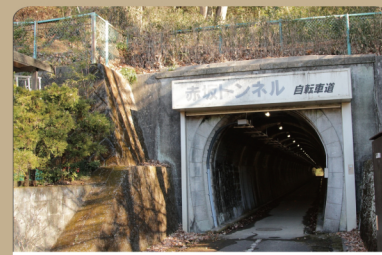
⑦ 赤坂トンネル (武蔵村山市) 山口貯水池建設時、資材運搬の鉄道を通すために作られた。(横田、赤堀、御岳トンネルも同様)