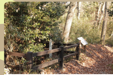
④ 大多羅法師の井戸 (中藤公園内) 昔は豊富に水がわき、生活用水にも使われていた。