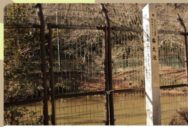
⑥ 番太池 (武蔵村山市) かんがいようすいち 昔は田んぼの灌漑用水池として使われていた池。