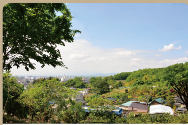
⑤ 桜の丘 (中藤公園内) 谷戸地形、街並みを望む丘。春は桜も美しい。