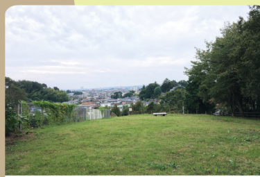
③ 芝生広場 (中藤公園内) 武蔵村山市の街並みを望む、丘の上にある広場。