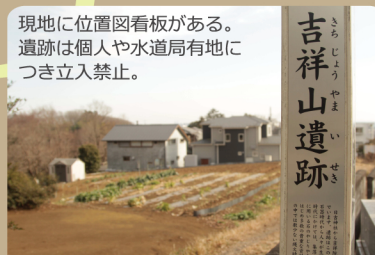
① 吉祥山遺跡 (武蔵村山市) ※看板設置者 旧石器～平安時代の出土品等が発掘された。(出土品は武蔵村山市立歴史民俗資料館で常時展示されている)

【マップの見方】 濃い緑…中藤公園 ※2020年現在の開園エリア 点線…おすすめルート ※複雑に交差するため、折返しを境に2色(---)で示しています。 ①～⑦…おすすめスポット