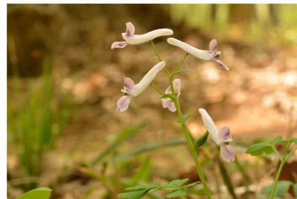
1 ジロボウエンゴサク 撮影：4月中旬 場所：車道沿いの林縁