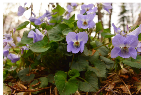
5 タチツボスミレ 撮影：4月初旬 場所：エケ入谷戸 など