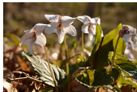
3 ナガバノスミレサイシン 撮影：3月下旬 場所：後ヶ谷戸