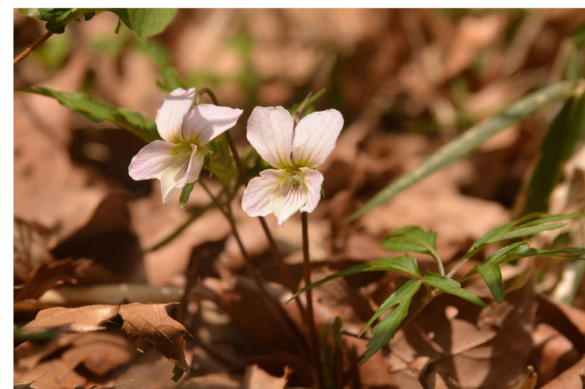
6 エイザンスミレ 撮影：3月下旬 場所：尾根道