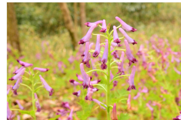
2 ムラサキケマン 撮影：4月初旬 場所：車道沿いの林縁