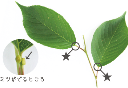
ミツがでるところ

☆のぷつぶんからミツがでるよ。サクラのしゅるいによって、☆のあるばしょがちがうよ。