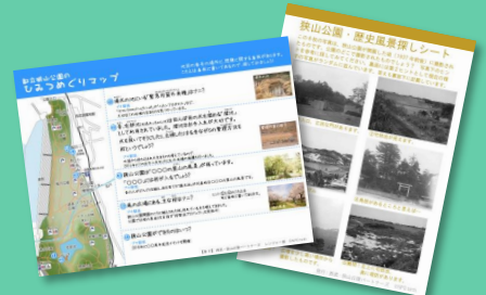
歴史・自然保護紹介 など