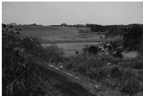
②宅部池が見えます。