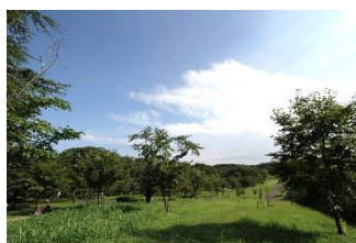
B.桜坂から風の広場を眺められる場所