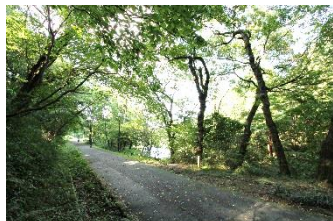
A.野鳥の森と青年の森の間の道

この写真は、表の古い写真の今の様子をランダムに並べています。 正解の組み合わせは、この面の一番下に記載しています。