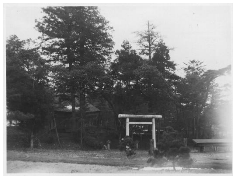
④鳥居があるところと言えば…