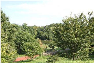
E.堤防から宅部池を眺められる場所