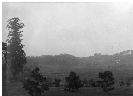
⑤難問！ 広場を少し高い場所から撮影したものです。