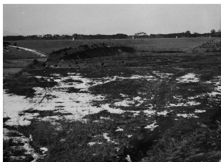
⑥難問！左上に宅部池、奥に堤防があります。