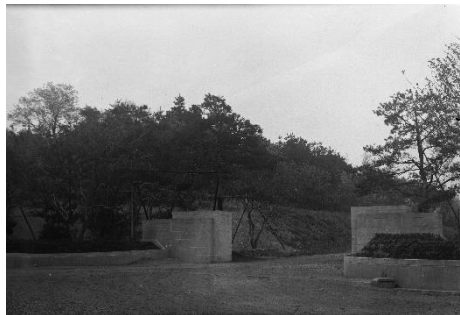
①公園の入口。立派な門があります。

この6枚の写真は、狭山公園が開園した頃（1937年前後）に撮影されたものです。公園のどこで撮影されたものでしょう？ 写真下のヒントを参考に探してみてください。裏面には第2ヒントとして現在の様子の写真がランダムに並んでいます。答えも裏面下に記載しています。