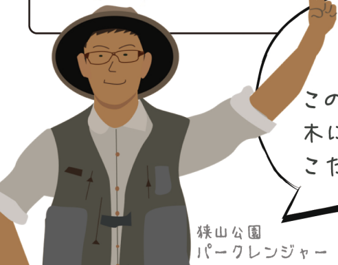
狭山公園 パークレンジャー