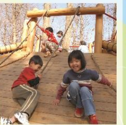
冒険の森 あそびの森とあわせて30のフィールドアスレチックがあります。