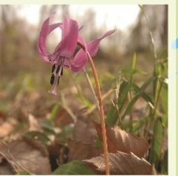
カタクリ自生地 見頃はソメイヨシノと同じ時期です。