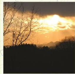
六道広場からみた夕日