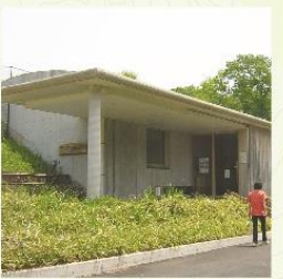
野山北・六道山公園インフォメーションセンター(管理所)