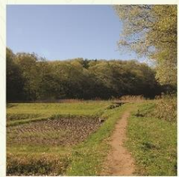
岸たんぼの春の風景